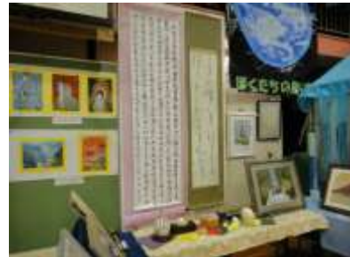
(PTA・地域の方々の作品)